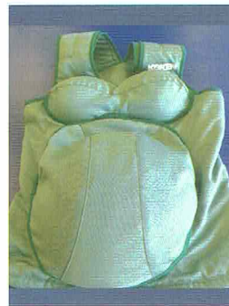
“重い妊婦ジャケット”

入室時にはリアルな人形を見て「こわー!」と言っていた男子生徒が終了時には嬉しそうに人形を抱っこしている様子が印象的でした。8月2日には宮本児童ホームで地域の乳幼児親子と触れ合う体験も予定されています。