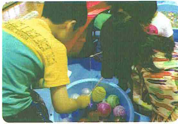
集中する子どもたち

る子どももいます。射的でも何度も挑戦をする子どももいれば、一発で打ち抜く子どももいます。簡単に出店の挑戦をクリアするヒーロー、ヒロインたち、何度も諦めず挑戦する勇者たちの笑顔が輝いていました。