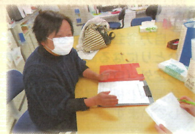
訪問、支援を行う生活支援員