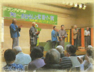
ボランティア講座

地域の福祉力を高めるため、ボランティア活動を行うための研修や講座を実施し、新たな担い手の発掘やボランティアのスキルアップを図る事業です。