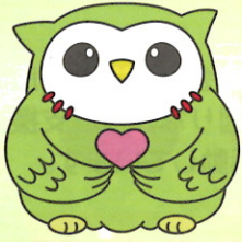
船橋市社協マスコットキャラクター「ふくしろろう」