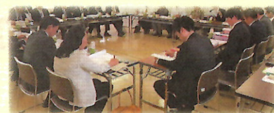
居住支援協議会の会議

転居を検討されている高齢者や障がいのある方などを対象に、民間賃貸住宅の物件情報や居住支援サービスの提供を行い、賃貸住宅への入居をお手伝いしています。