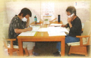
電話による見守り活動

登録者への日常的な見守り活動（訪問・電話・はがき・防災訓練等）を通じ、緊急時や災害時において、地域の皆様方（地区連絡協議会〔町会・自治会〕や民生委員・児童委員などの支援により、安否確認や避難支援にできる限り迅速かつ適切につなげることを目的としています。