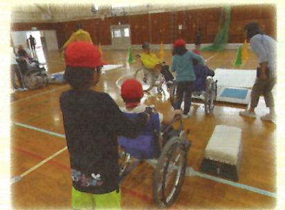
小学校での福祉教育