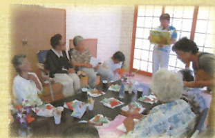
紙芝居の読みきかせ

高齢者をはじめ、障がいのある方、子どもたちなど、地域の人たちの誰もが参加でき、参加者自身が企画する趣味やレクリエーション（ゲームなど）を通じて世代を超えた仲間づくりの場を提供しています。