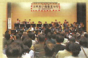
近隣学校による演奏

地域の人たちや関係機関・団体等との交流を通じて、地区社協や地域福祉の大切さを広めるとともに福祉への関心を深めてもらう地域密着のおまつりです。