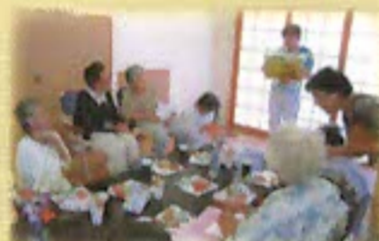
紙芝居の読みきかせ

高齢者をはじめ、障がいのある方、子どもたちなど、地域の人たちの誰もが参加でき、参加者自身が企画する趣味やレクリエーション（ゲームなど）を通じて世代を超えた仲間づくりの場を提供しています。