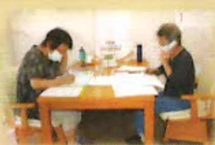
電話による見守り活動

登録者への日常的な見守り活動（訪問・電話・はがき・防災訓練等）を通じ、緊急時や災害時において、地域の皆様方（地区連絡協議会〔町会・自治会〕や民生委員・児童委員などの支援により、安否確認や避難支援にできる限り迅速かつ適切につなげることを目的としています。