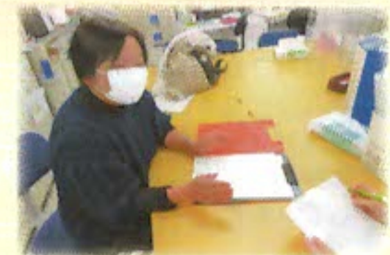
訪問、支援を行う生活支援員