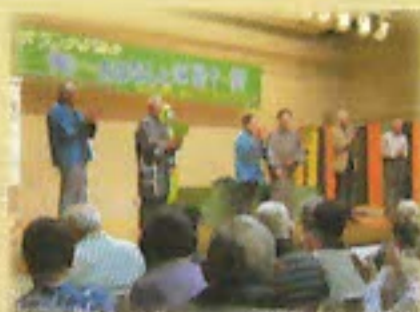
ボランティア講座

地域の福祉力を高めるため、ボランティア活動を行うための研修や講座を実施し、新たな担い手の発掘やボランティアのスキルアップを図る事業です。