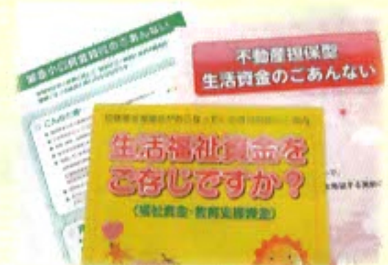
生活福祉資金のパンフレット