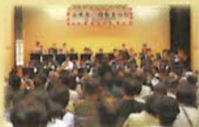
近隣学校による演奏

地域の人たちや関係機関・団体等との交流を通じて、地区社協や地域福祉の大切さを広めるとともに福祉への関心を深めてもらう地域密着のおまつりです。