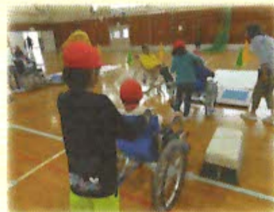
小学校での福祉教育