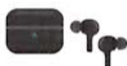
ワイヤレス イヤホン