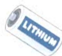
リチウム イオン電池

・純正品の小型充電式電池は、電気店やスーパー等にある「 充電式電池リサイクルボックス 」でも、引き続き回収を行います。