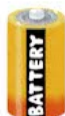
ニッケル 水素電池