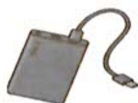
モバイル バッテリー