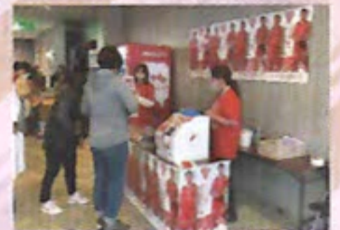
試合会場での募金活動