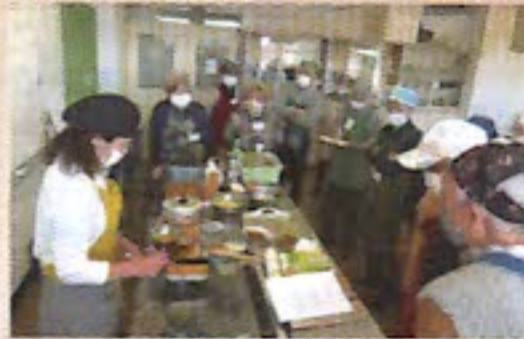
地区社協の事業（料理教室）

5月に新型コロナウイルス感染症の分類が5類になったことで行動制限が撤廃されたことにより、全ての事業が本格的に再開しました。