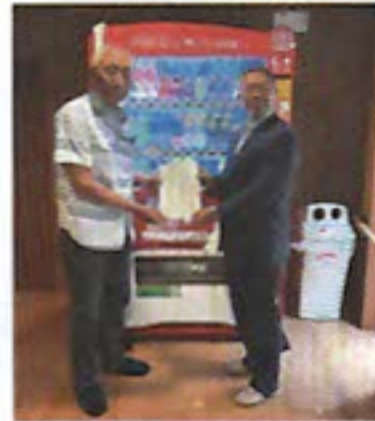
(福)南生会様（施設内）