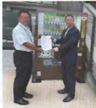
(株)よみうりランド様（船橋競馬場内）