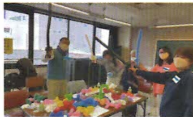
バルーンアート体験の様子

今年度も開催いたしますので、ボランティアへ興味がありましたら、是非ご参加をお待ちしております。