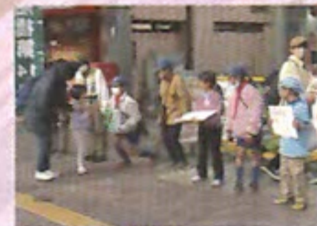
街頭募金活動（ボーイスカウト）