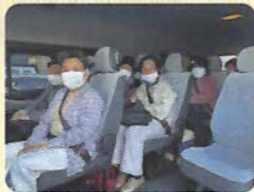
買い物送迎サービスの車中