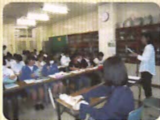
中学生ボランティア研修会の様子

当地区の特色ある取り組みとしては、海老が作公民館に隣接する大穴中学校生徒にボランティア活動を体験していただくため、毎年学校へ協力をお願いし、事前研修を受講後、ミニデイ・子育てプレイルーム・ふくしまつり・地域の行事にボランティアとして参加していただいています。今後も「地域のつながり」を目標に、お年寄りから子どもまで幅広い世代が楽しみ、交流できるさまざまな事業を創意工夫しながら計画し、実施していきます。