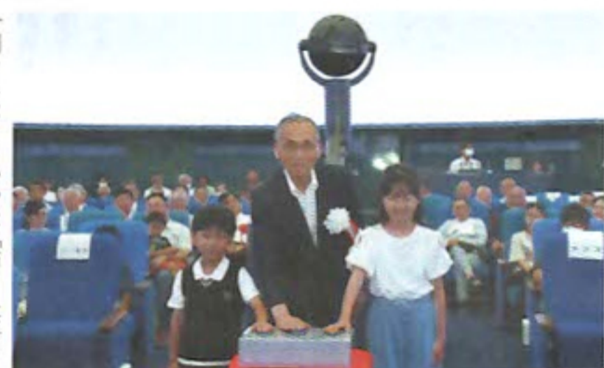
プラネタリウムリニューアルオープニングセレモニー

今年1月の能登半島地震の例を見るまでもなく、避難所運営は行政等公助にすべて依存することはできず、避難者を中心とした自助・共助によって運営しなければなりません。すでに市内小中