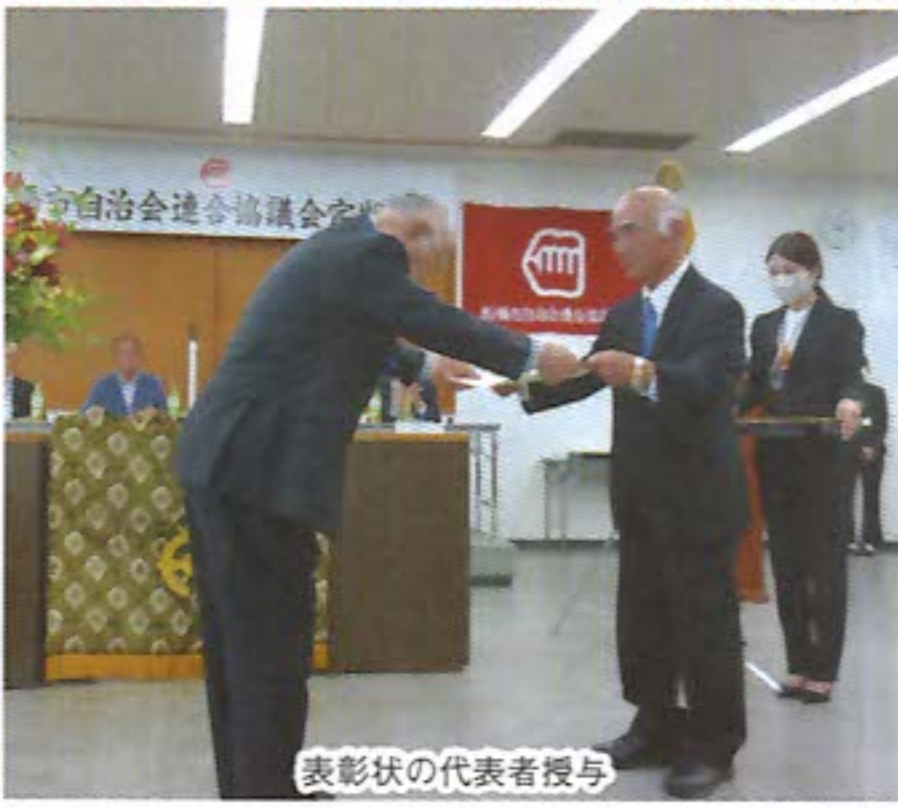
表彰状の代表者授与

が基本です。そして相手に怪我をさせないことがもっとも重要です。近年自転車事故賠償が多額になっていることは誰もが知っているはず。保険加入だけでは、ヘルメット着用を実践してみませんか。ただ、毎朝通学時に顔を合わせ高校生男女何人かにヘルメット着用を勧めたところ、置き場所がない、盗まれるという返事でした。折々、補助件数 8000件、専用ダイヤル 47(436)8854 市長 早川 淑男 補助金制度の概要 補助金額 2000円 申込受付 9月2日 令和7年1月31日 補助件数 8000件 専用ダイヤル 47(436)8854 市民安全推進課