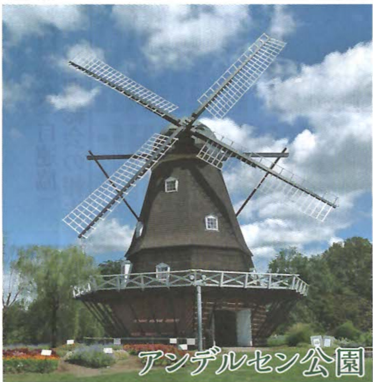
アンデルセン公園

防犯灯の町会管理については、加入率向上のための説得材料となる一方、近年まわりの電気屋さんが高齢化の為廃業するケースも見受けられ、器具交換等が生じた場合など苦慮することが多く、市への管理を希望する声が多く聞かれます。今後の課題となっています。