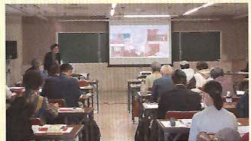
松岡教授による講演会