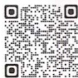
ホームページ二次元コード

支援を必要とする方やそのご家族などがお住まいの地域のたすけあいの会を調べることができるよう、11月から市社協ホームページ「地図で探す」のページにて市内の「たすけあいの会」を公開していますので、ご興味のある方は、右の二次元コードを読み込んでいただき、ホームページにて内容を確認の上、各団体までお問い合わせください。