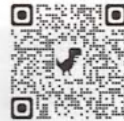
ホームページ二次元コード

ご興味のある方は、左下の二次元コードを読み込んでいただき、ホームページにてご覧ください。