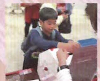
子ども達の募金活動