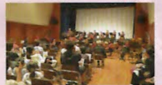
葛飾小音楽部の演奏