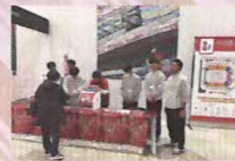
学生ボランティアと一緒に募金活動

船橋市支会では、赤い羽根サポーターである「千葉ジェッツふなばし」のご協力により、新たにホーム会場となりましたLaLa arena TOKYO-BAY(JR南船橋駅より徒歩6分)で募金活動しております。500円以上の募金をしていただいた方にはコラボピンバッジをプレゼントしておりますので、会場で見かけられた際は、是非お立ち寄りください。