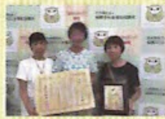
高根台よろこびの会