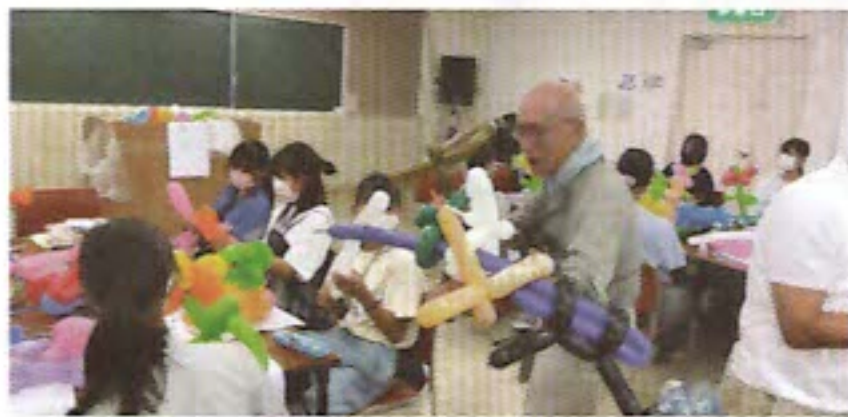
ペンシルパルーン体験

「今までしたことがなく、そしてこれからもできるかわからない貴重な興味深い体験をさせていただき、ありがとうございました。とても楽しかったです！次回もよければ参加してみたいです」等、うれしい感想をたくさんいただきました。来年も、楽しく参加できるボランティア講座を開催しますので、ご参加お待ちしております。