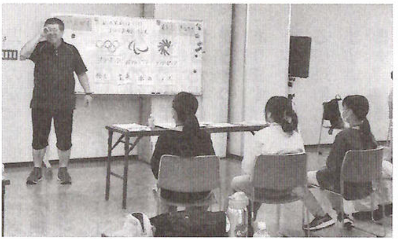
中学生ボランティア養成講座

少団連は今後もこうした交流を重ね、地域に根ざした少年少女活動の充実と健やかな成長に寄与してまいります。青少年の健全育成にご協力いただける団体がございます。市役所青少年課までご連絡をお願いいたします。