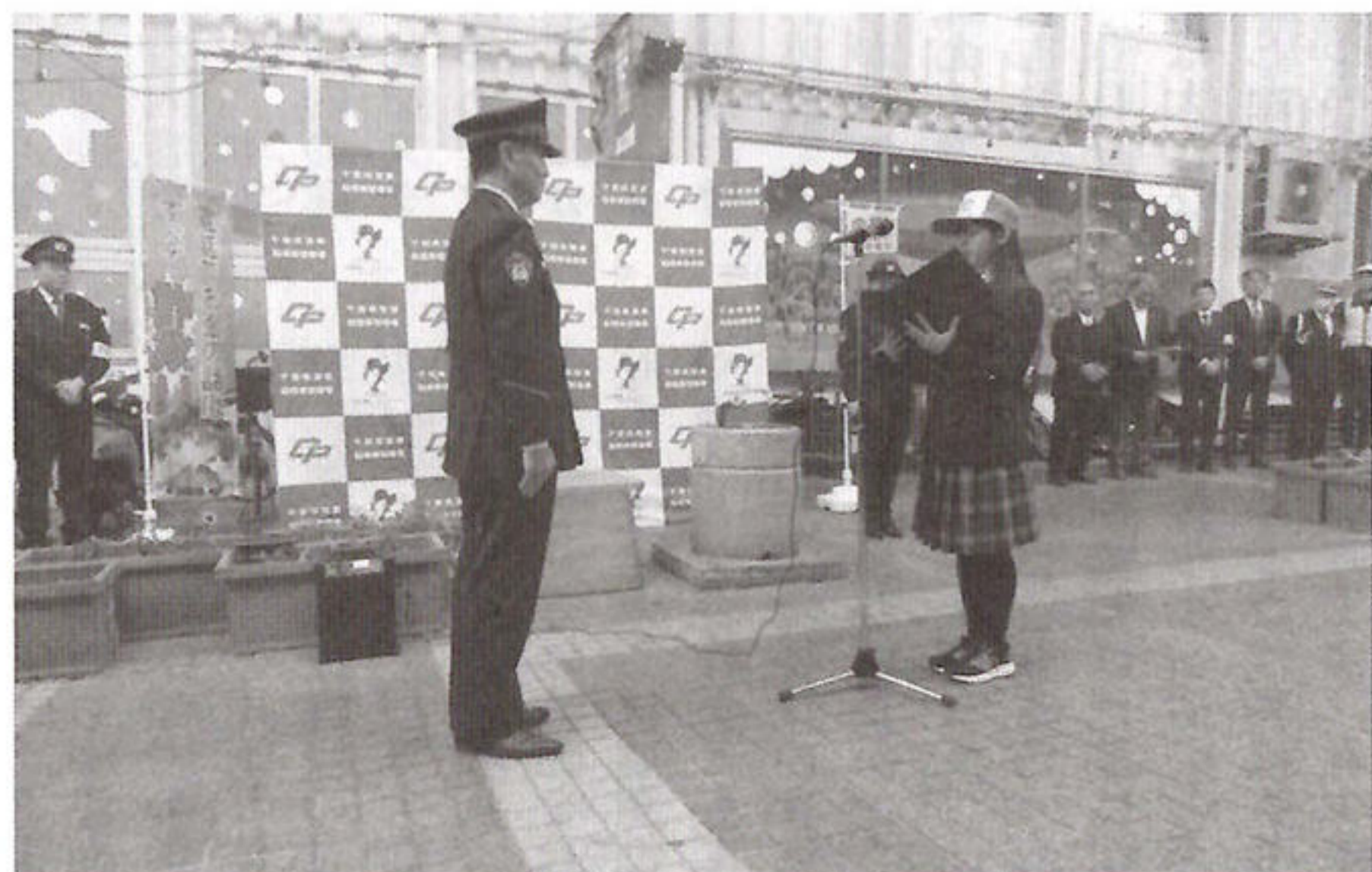
【高校生による闇バイト撲滅宣言】